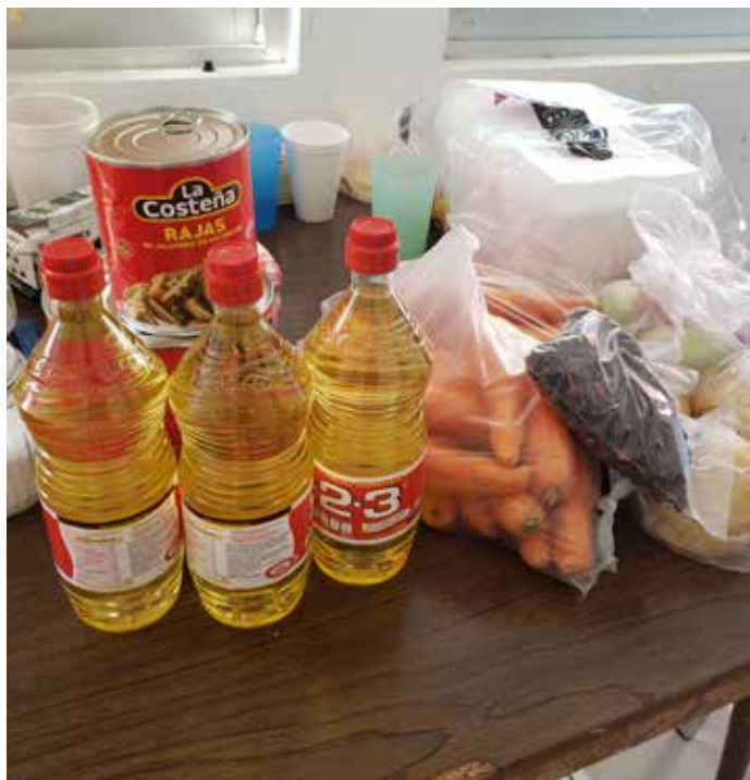
ASISTENCIA SOCIAL ALIMENTARIA EN LOS PRIMEROS 1000 DÍAS DE VIDA

Este programa tiene como objetivo dar el apoyo a niñas y niños lactantes mayores de 12 a 24 meses de edad, de alto grado de marginación y con presencia de desnutrición. Se han entregado la dotación de insumos a 97 BENEFICIARIOS DE 15 LOCALIDADES DEL MUNICIPIO desde que se creó este programa. Esta modalidad tiene una cuota de recuperación simbólica de 8 pesos mensuales por beneficiario.