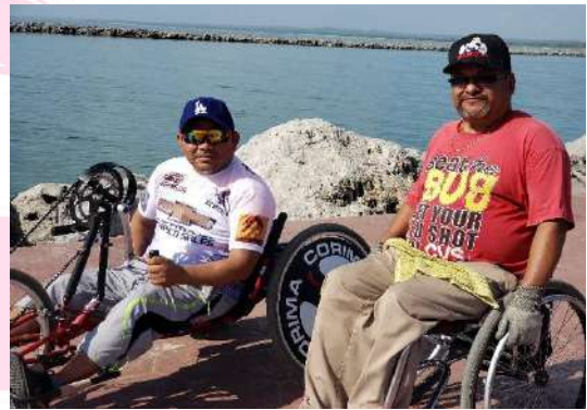
CIUDAD FERNÁNDEZ H. AYUNTAMIENTO 2018 - 2021